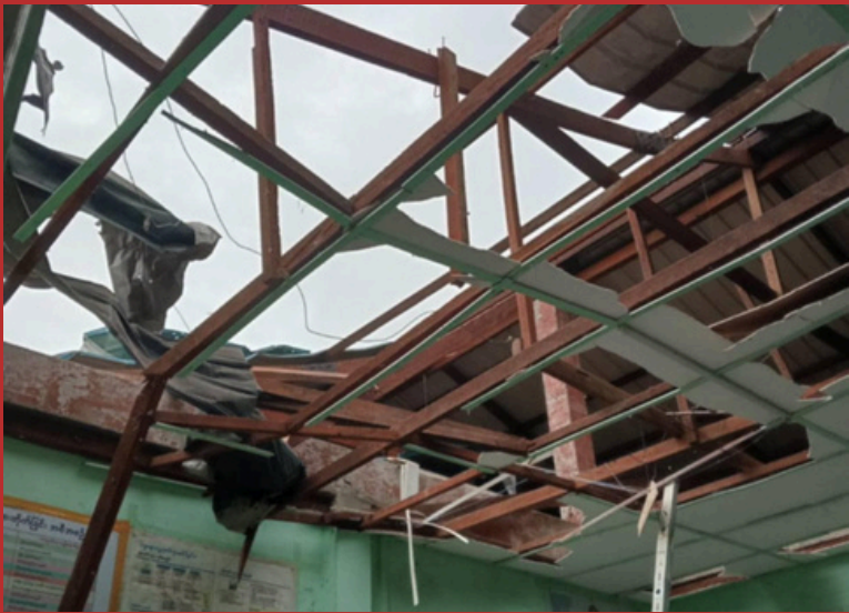
SAC troops shelled a school in Kler Lwee Htoo District on August 21, 2024. Five schoolchildren were injured and the school shelter was damaged. A community leader said that the shelling happened during school hours and that a bomb struck a temporary learning center. KECD is calling for immediate action to address the violations of education and human rights.